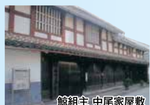
鯨組主 中尾家屋敷

毎日開催される呼子名物「呼子朝市」。とれたての海の幸、山の幸がところせましと並び賑わいをみせます。 ※AM7:30~12:00 定休日：元旦のみ