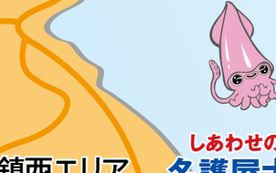
しあわせの橋 名護屋大橋

「中尾様には及びませぬが、せめてなりたや殿様に」と言われた、江戸時代、捕鯨で七浦をうろちた鯨組主の屋敷。江戸時代からのそのままの姿を残しております。 休館日:水曜日(祝日の場合翌日)、年末年始 入館料:大人200円、小人100円